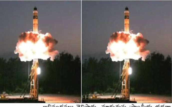
అభినందనలు తెలిపారు. మారుతున్న ప్రాంతీయ భద్రతా సవాళ్ల దృష్ట్యా, ఈ క్షిపణి భారత్ యొక్క అణ్వాయుధ నిరోధక శక్తిని మరింత బలోపేతం చేస్తుందని ఆయన పేర్కొన్నారు. ఈ ప్రయోగం విజయవంతం కావడంతో భారత్ తన రక్షణ రంగంలో స్వయం సమృద్ధి దిశగా మరో భారీ అడుగు వేసినట్లుంది.

ఎమ్.బి.ఆర్.వి సాంకేతికత ప్రత్యేకత.. సాధారణ క్షిపణులు ఒకే వార్ హెడ్ ను మోసుకెళ్లి ఒకే లక్ష్యాన్ని తాకుతాయి. కానీ, ఈ సరికొత్త ఎమ్.బి.ఆర్.వి సాంకేతికత వల్ల ఒకే క్షిపణిలో అనేక వార్ హెడ్ లను అమర్చవచ్చు. ఇవి అంతరిక్షం నుండి తిరిగి భూ వాతావరణంలోకి ప్రవేశించేటప్పుడు విడిపోయి, వేర్వేరు దిశల్లో ఉన్న శత్రువుల స్థావరాలను ఒకేసారి ధ్వంసం చేస్తాయి. ఈ రకమైన సాంకేతికత ప్రస్తుతం ప్రపంచంలోని అతికొద్ది దేశాల వద్ద మాత్రమే ఉంది. డిఫెన్స్ రీసెర్చ్ అండ్ డెవలప్ మెంట్ ఆర్గనైజేషన్ న్వదేశీ పరిష్కారంతో ఈ క్షిపణిని రూపొందించింది. ఈ విజయవంతమైన ప్రయోగంపై రక్షణ మంత్రి రాజ్ నాథ్ సింగ్ హార్దం వ్యక్తం చేశారు. డీఆర్ డీఓ శాస్త్రవేత్తలు, భారత సైన్యం మరియు రక్షణ పరిశ్రమలకు ఆయన