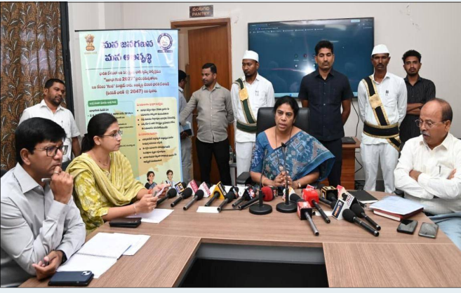
హైదరాబాద్ పల్స్ న్యూస్, ఏప్రిల్ 30 కొమరం భీం ఆసిఫాబాద్ జిల్లా ప్రతినిధి:

కొమరం భీం ఆసిఫాబాద్ జిల్లా జనాభా గణన-2027లో భాగంగా ఏప్రిల్ 26 నుండి మే 10 వరకు పౌరులు తమ ఇంటి వివరాలను స్వీయ గణన ద్వారా ఆన్‌లైన్‌లో నమోదు చేసుకోవచ్చని కలెక్టర్ హరిత తెలిపారు. మే 11 నుండి జూన్ 9 వరకు ఎన్యూమరేటర్లు ఇంటింటికి వెళ్లి 33 అంశాల వివరాలు నమోదు చేస్తారు. జిల్లాలో 994 మంది ఎన్యూమరేటర్లు, 174 మంది సూపర్‌వైజర్లు, 1,689 హౌస్ లిస్టింగ్ బ్లాకులు గుర్తించారు. ఉపాధి హామీ పని ప్రదేశాల్లో కూలీలకు నీడ, త్రాగునీరు, ఓఆర్ఎస్ ప్యాకెట్లు అందుబాటులో ఉంచుతారు. ఎండ తీవ్రత దృష్ట్యా ఉదయం 10 గంటలకే పని ముగించాలి. నకిలీ విత్తనాలు రైతులు అనధికారిక విత్తనాలు, మందులు కొనుగోలు చేయరాదు. కొనుగోలు చేసేటప్పుడు ఆన్‌లైన్ రశీదు తప్పనిసరిగా తీసుకోవాలి. నిబంధనలు ఉల్లంఘించిన వారిపై చర్యలు తీసుకుంటారు. ధాన్యం కొనుగోలు యాసంగి వరి ధాన్యం కొనుగోలుకు 34 కేంద్రాలు ఏర్పాటు చేస్తున్నారు. ఎ గ్రేడ్ ధాన్యానికి క్వింటాలుకు ?3,389, సాధారణ రకానికి ?2,369 మద్దతు ధర ఉంది. సన్న రకానికి అదనంగా రూ. 500 బోనస్ లభిస్తుంది. కొనుగోలు, రవాణా డిజిటల్ యాప్ ద్వారా నిర్వహిస్తారు. జిల్లాలో పెట్రోల్, డీజెల్ కొరత లేదని, పుకార్లు నమ్మవద్దని కలెక్టర్ స్పష్టం చేశారు.