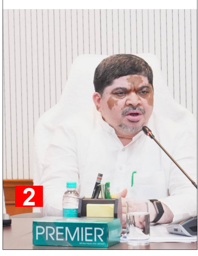
హైదరాబాద్ పల్స్ హైదరాబాద్

ఆర్టీసీని ప్రభుత్వంలో విలీనం చేయడం సహా పలు డిమాండ్లకు తమ ప్రభుత్వం అంగీకరించినది తెలంగాణ రాష్ట్ర మంత్రి పాన్సం ప్రభాకర్ వెల్లడించారు. కాంగ్రెస్ పార్టీ డీసీసీ అధ్యక్షులు, ఎంపీలు, ఎమ్మెల్యేలు, ఎమ్మెల్సీలు, కార్పొరేషన్ చైర్మన్లు, అధికార ప్రతినిధులతో ఆయన