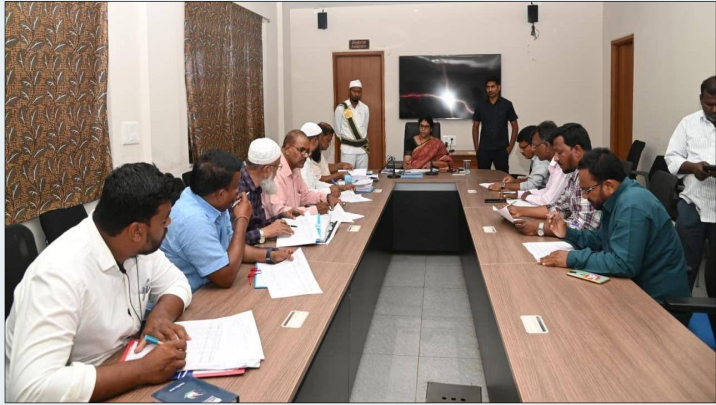
హైదరాబాద్ పల్స్ న్యూస్, ఏప్రిల్ 25, కొమరం భీం ఆసిఫాబాద్ జిల్లా ప్రతినిధి: