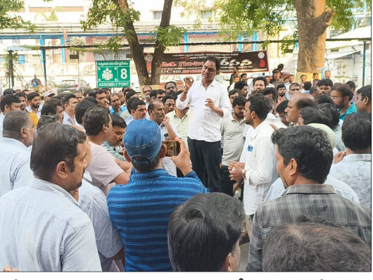
చేకూర్చిన కార్మిక సోదరులు అందరికీ కూడా ప్రత్యేకమైన కృతజ్ఞతలు తెలియజేసుకుంటున్నామన్నారు. ఈ కార్యక్రమంలో పెద్ద సంఖ్యలో కార్మికులు పాల్గొని తమ సంఘీభావాన్ని తెలిపారు.