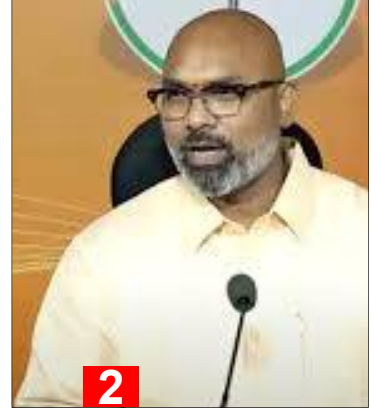
హైదరాబాద్ పల్స్ హైదరాబాద్

కల్వకుంట్ల కవిత తన సొంత రాజకీయ పార్టీని ప్రారంభించిన సంగతి తెలిసింది. తెలంగాణ రాష్ట్ర సేన (బీఆర్ఎస్) పేరుతో ఆమె పార్టీని ప్రకటించారు. కవిత పార్టీపై నిజామాబాద్ బీజేపీ ఎంపీ ధర్మపురి అర్జున్ ఘాటు వ్యాఖ్యలు చేశారు. బీజేపీపై ఆమె చేసిన విమర్శలకు కొంటర్