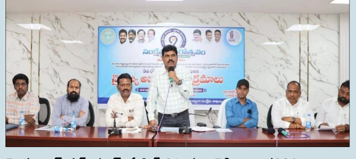
హైదరాబాద్ పల్స్ న్యూస్, ఏప్రిల్ 24, సంగారెడ్డి జిల్లా ప్రతినిధి:

విద్యార్థులకు లక్ష్య నిర్దేశం, వాటి ప్రపంచంలో నైపుణ్యాల ప్రాముఖ్యతపై విశ్లేషణ