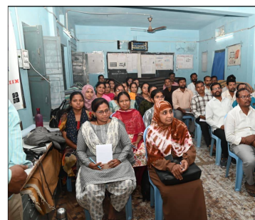
ప్రక్రియ పూర్తి చేయాలని కలెక్టర్ నిర్దేశించారు.