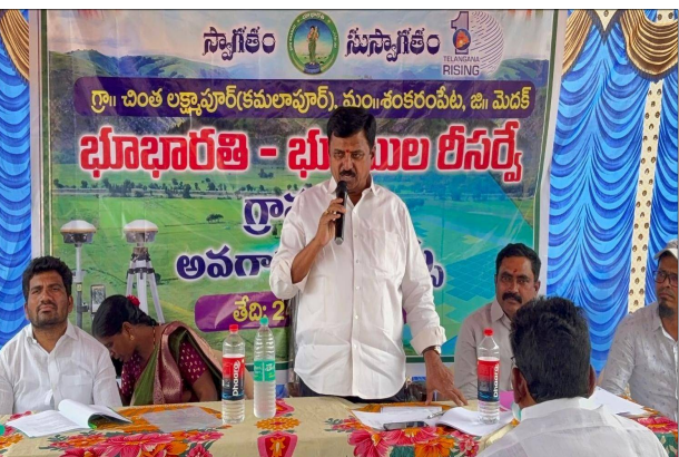
ప్రజాప్రతినిధులు, రెవెన్యూ అధికారులు, సర్వే సిబ్బంది మరియు గ్రామ రైతులు పెద్ద ఎత్తున పాల్గొన్నారు.

సమయంలో రైతులు క్షేత్రస్థాయిలో ఉండి తమ భూమికి సంబంధించిన సరిహద్దులను అధికారులకు చూపించాలని, ఏవైనా తప్పులు ఉంటే వెంటనే సరిచేసుకోవాలని సూచించారు. పారదర్శకత: ఆధునిక సాంకేతిక పరిజ్ఞానంతో సాగుతున్న ఈ సర్వే అత్యంత పారదర్శకంగా జరుగుతుందని, దీనివల్ల భవిష్యత్తులో భూ తగాదాలకు ఆస్కారం ఉండదని పేర్కొన్నారు. అధికారులకు ఆదేశం: సర్వే ప్రక్రియలో రైతులకు ఎలాంటి ఇబ్బందులు కలగకుండా చూడాలని, ప్రతి రైతుకు అవగాహన కల్పించాలని అధికారులను ఆదేశించారు. ఈ కార్యక్రమంలో