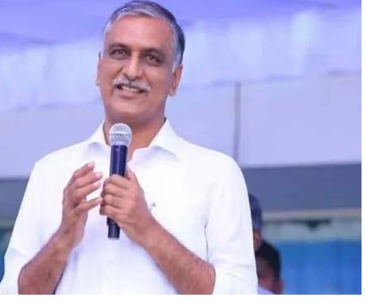
యాజమాన్య ఆస్తులు రెవెన్యూ రికవరీ చట్టం కింద అటాచ్ చేసి, రూ.1 కోటి పరిహారం చెల్లించాలి. పిఎఫ్, ఈఎస్ఐ తో సంబంధం లేకుండా పూర్తి హామీ నెరవేర్చాలని, బాధితులను మోసం చేయకూడదని సూచించారు.