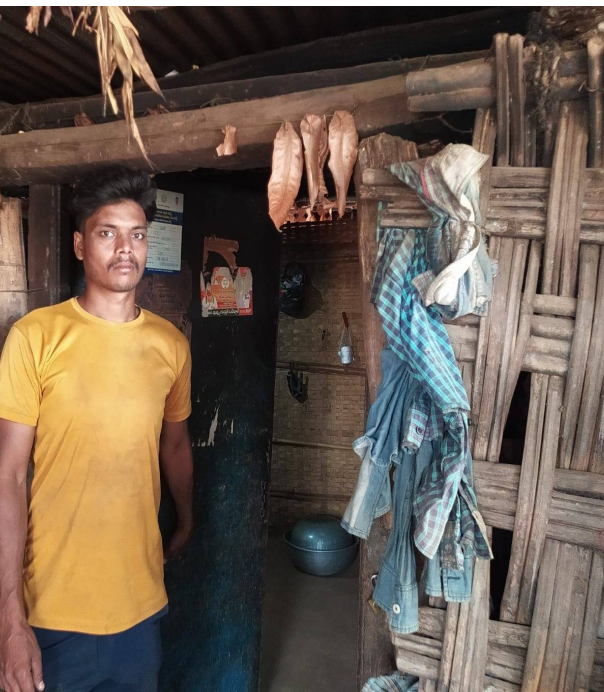
అభివృద్ధి సాధ్యమవుతుందని స్థానికులు అభిప్రాయపడుతున్నారు. మొత్తంగా, సరండి గ్రామంలో ప్రజాప్రతినిధుల నిర్లక్ష్యం ప్రజల్లో అసంతృప్తిని పెంచుతూ, అభివృద్ధి పనులను ప్రభావితం చేస్తోందని స్పష్టమవుతోంది. ఈ సమస్యలను త్వరగా పరిష్కరించకపోతే భవిష్యత్తులో పరిస్థితులు మరింత దిగజారే ప్రమాదం ఉందని గ్రామ ప్రజలు హెచ్చరిస్తున్నారు. అధికారులు, ప్రజాప్రతినిధులు సమన్వయంతో పనిచేసి గ్రామాభివృద్ధికి కృషి చేయాలని గ్రామస్థులు ఆశిస్తున్నారు.

అధికారుల దృష్టికి ఈ సమస్యలను తీసుకెళ్లినా పెద్దగా స్పందన లేదని కొందరు ఆరోపిస్తున్నారు. దీనివల్ల ప్రజల్లో నిరుత్సాహం పెరుగుతోంది. గ్రామంలోని యువత కూడా ఈ పరిస్థితులపై అసంతృప్తి వ్యక్తం చేస్తున్నారు. గ్రామ అభివృద్ధి కోసం కొత్త ఆలోచనలు, కార్యక్రమాలు అవసరమని భావిస్తున్నప్పటికీ, ప్రజాప్రతినిధుల నిర్లక్ష్యం కారణంగా అవి అమలు కావడం లేదని అంటున్నారు. గ్రామంలో మౌలిక వసతులు పెరుగుపడకపోతే భవిష్యత్తులో మరింత సమస్యలు తలెత్తే అవకాశముందని హెచ్చరిస్తున్నారు. ఇప్పటికైనా సంబంధిత వార్డు సభ్యులు, ఉప సర్పంచ్ తమ బాధ్యతలను గుర్తించి ప్రజల సమస్యలపై దృష్టి సారించాలని గ్రామ ప్రజలు కోరుతున్నారు. గ్రామసభలను సక్రమంగా నిర్వహించి ప్రజల సమస్యలను ప్రాధాన్యతగా తీసుకుని పరిష్కరించాల్సిన అవసరం ఉందని సూచిస్తున్నారు. ప్రజలతో నేరుగా మాట్లాడి వారి అభిప్రాయాలను తెలుసుకుని చర్యలు తీసుకోవాలని కోరుతున్నారు. అలాగే, మండల స్థాయి అధికారులు కూడా ఈ పరిస్థితిపై దృష్టి సారించి సరండి గ్రామంలో నెలకొన్న సమస్యలను పరిశీలించాలని గ్రామ ప్రజలు విజ్ఞప్తి చేస్తున్నారు. ప్రజాప్రతినిధుల పనితీరుపై సమీక్ష నిర్వహించి అవసరమైన చర్యలు తీసుకోవాలని కోరుతున్నారు. ప్రజలకు న్యాయం జరిగేలా చర్యలు తీసుకుంటేనే గ్రామంలో