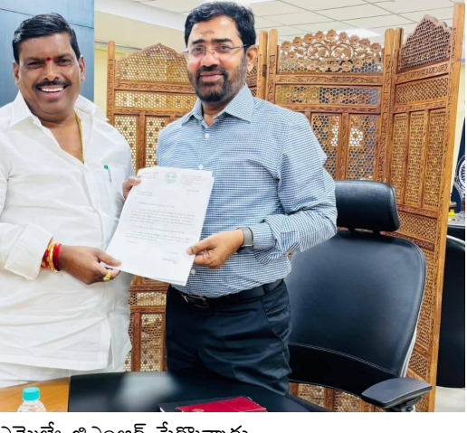
ఎమ్మెల్యే జిఎంఆర్ పేర్కొన్నారు.

తీసుకెళ్లారు. ప్రస్తుత వేసవి కాలంలో ప్రతి రోజు ట్యాంకర్లను ఆశ్రయించాల్సి వస్తుందని తెలిపారు. పైన పేర్కొన్న కాలనీలలో నూతన పైపులైన్ ఏర్పాటు కోసం ఇప్పటికే ప్రతిపాదనలు తయారు చేయడం జరిగిందని.. రెండు కోట్ల నిధులు మంజూరు చేస్తే నీటి సమస్యకు శాశ్వత పరిష్కారం లభిస్తుందని తెలిపారు. ఇందుకు సానుకూలంగా స్పందించిన ఎండి అశోక్ రెడ్డి. అతి త్వరలో నిధుల మంజూరుకు ఆదేశాలు జారీ చేస్తామని తెలిపినట్లు