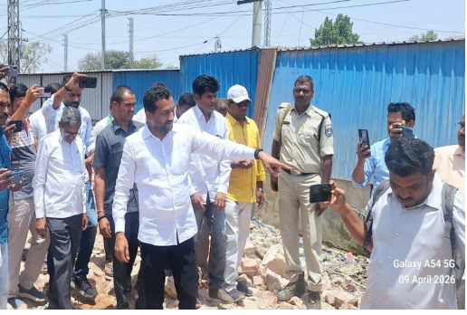
అన్నికోర్టుల్లోనూ ఓడిపోయారని గుర్తు చేశారు. పాఠశాల స్థలాన్ని కాపాడాల్సిన అధికారులు కట్టాదారులకు అనుకూలంగా వ్యవహరించారని ఆరోపించారు. ఈ విషయంలో జిల్లాకలెక్టర్ స్పందన పట్ల ఆగ్రహం వ్యక్తంచేశారు. వెంటనే అధికారులను పంపి విచారణ జరిపి బాధ్యులపై చర్యలు తీసుకోవాల్సింది పోయి ఉదాసీనంగా వ్యవహరించారని ఆరోపించారు. ఇప్పటికైనా బాధ్యులపై చర్యలు తీసుకోవాలని డిమాండ్ చేశారు. లేనిపక్షంలో స్థానికులతో కలిసి పెద్ద ఎత్తున ఆందోళన చేస్తామని హెచ్చరించారు. జాతీయ రహదారి విస్తరణకు, పాఠశాల కూల్చి వేతకు ఎలాంటి సంబంధం లేదని స్పష్టం చేశారు.

తాను ఫోన్ చేసి కలెక్టర్ కు, డీసీపీ కి ఫిర్యాదు చేసేవరకు కూల్చివేతలు కొనసాగాయని తెలిపారు. జాతీయ రహదారి విస్తరణకు పాఠశాల అడ్డుగా లేకున్నా ఎందుకు కూల్చివేశారు, ఎవరు కూల్చారు, ఎవరి ఆదేశాలతో కూల్చారో సమగ్ర విచారణ జరిపి బాధ్యులపై చర్యలు తీసుకోవాలని డిమాండ్ చేశారు. పాఠశాల ప్రహారికి ముందు ఉన్న దుకాణాలు తొలగించకుండా ప్రహారి నుంచి వది అడుగుల దూరంలో ఉన్న భవనాన్ని రాత్రికి రాత్రి ఎందుకు కూల్చాల్సి వచ్చిందని ప్రశ్నించారు. 1962 కు పూర్వం నుంచే అక్కడ పాఠశాల ఉందని, భవన నిర్మాణానికి ప్రభుత్వం నిధులు మంజూరు చేసిన ప్రాసిడింగ్స్ చూపిస్తూ, సర్వే రిపోర్ట్ లను సైతం ఆయన ప్రదర్శించారు. స్థానికంగా ఉన్న కొందరు ఆ భూమి పై వివాదం సృష్టించి కింది కోర్టు నుంచి సుప్రీం కోర్ట్ వరకు