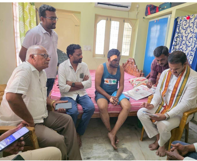
ప్రతి ఒక్కరూ జాగ్రత్తలు తీసుకోవాలని ఆయన కోరారు.

ఆర్థిక సహాయం అందజేసి, అవసరమైన అన్ని విధాలుగా తన సహకారం కొనసాగుతుందని హామీ ఇచ్చారు. జర్నలిస్టుల సంక్షేమం కోసం ప్రభుత్వం కట్టుబడి ఉందని పేర్కొన్నారు. అలాగే, తరచూ ప్రయాణాలు చేయాల్సిన జర్నలిస్టులు తమ భద్రతపై ప్రత్యేక శ్రద్ధ వహించాలని సూచించారు. జర్నలిస్టులు తమ విధులను నిర్వర్తించే క్రమంలో ఎన్నో కష్టాలు, సవాళ్లు ఎదుర్కొంటున్నారని గుర్తు చేస్తూ, వారి భద్రత, ఆరోగ్యం సమాజానికి కూడా ముఖ్యమని ఎమ్మెల్యే డాక్టర్ రామచంద్ర నాయక్ తెలిపారు. భవిష్యత్తులో ఇటువంటి ప్రమాదాలు జరగకుండా