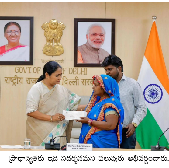
ప్రాధాన్యతకు ఇది నిదర్శనమని పలువురు అభివర్ణించారు.

అందించడం ప్రభుత్వ బాధ్యత. అప్పా ఘర్ ఆశ్రమం చేస్తున్న సేవలు ప్రశంసనీయం. వారి కార్యకలాపాలకు మా మద్దతు ఎల్లప్పుడూ ఉంటుంది' అని తెలిపారు. 'అప్పా ఘర్ ఆశ్రమం' నిర్వాహకులు మాట్లాడుతూ, ముఖ్యమంత్రి అందించిన ఈ సహాయం తమకు ఎంతో విలువైనదని, దీని ద్వారా మరిన్ని సేవలను విస్తరించగలమని తెలిపారు. ముఖ్యంగా, ఆరోగ్య సంరక్షణ, పోషకాహారం, మరియు పునరావాస కార్యక్రమాలపై దృష్టి సారీస్తామని వారు పేర్కొన్నారు. ఈ విరాళం, ఆశ్రమంలోని అత్యంత దుర్బలమైన వారికి ఆశాకరణంగా నిలుస్తుందని, వారి జీవన ప్రమాణాలను మెరుగుపరచడంలో సహాయపడుతుందని భావిస్తున్నారు. సమాజంలోని అట్టడుగు వర్గాల సంక్షేమానికి ప్రభుత్వం ఇస్తున్న