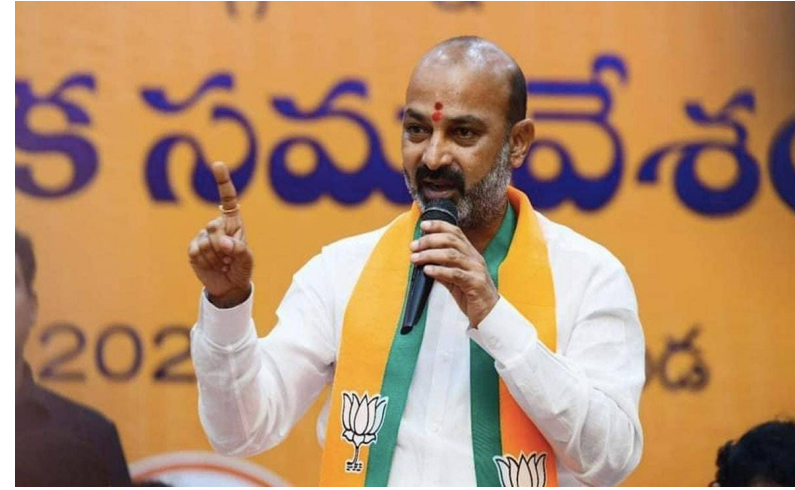
రజాకార్ వారసుల కోసం పంగి, పేదలపై మాత్రం విరుచుకుపడితే ఆ దిపాలన కాదని బలహీనమైన సమర్థన మాత్రమేనని విమర్శించారు.