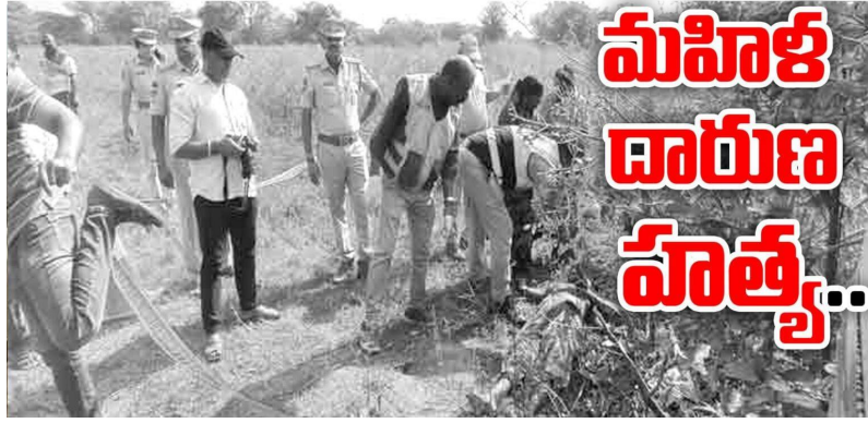
మహిళ దారుణ హత్య

విదారకమైన విషయం ఏమిటంటే, మృతురాలి మూడేళ్ల చిన్నారి తల్లి మృతదేహం వద్ద రాత్రంతా విడుస్తూ గడపడం. ఈ దృశ్యం చూసిన గ్రామస్థులు తీవ్ర దిగ్భ్రాంతికి గురయ్యారు.